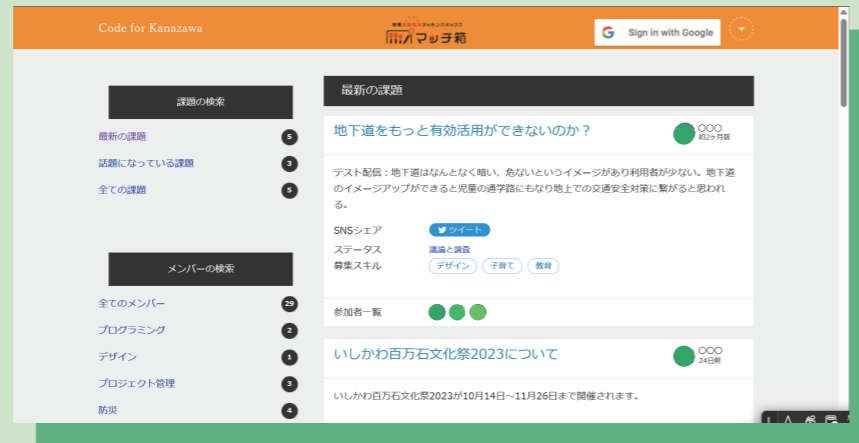
マッチ箱の詳しいご紹介は裏面にあります。