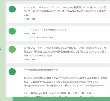
対話の中から解決アイデアを見つけます。